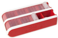
Liten, röd Art.Nr. 120045