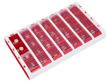
Stor, röd Art.Nr. 120055

Schine Pill Box är en förvaringsask för mediciner. Asken är klassad som medicinteknisk produkt klass I.