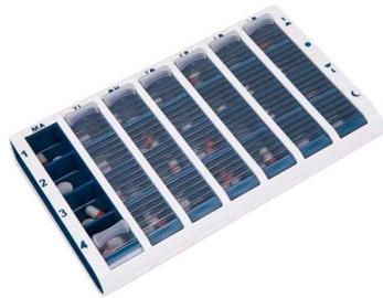
Stor, blå Art.Nr. 120050